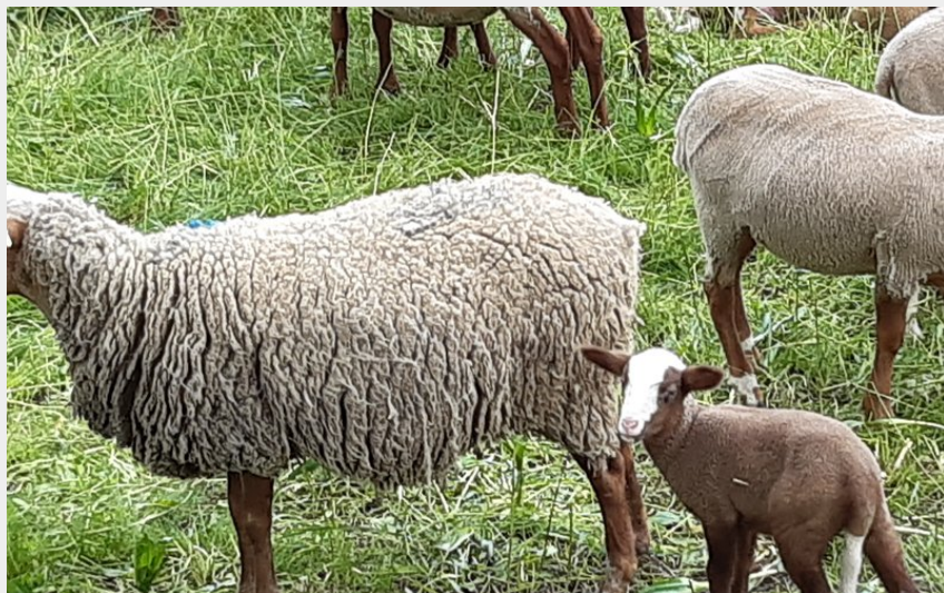
Un agneau près d'une ferme (florimont.tilliere)