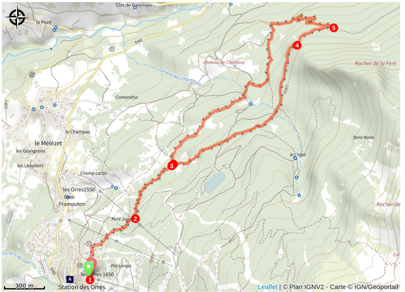
Station des Orres (A)