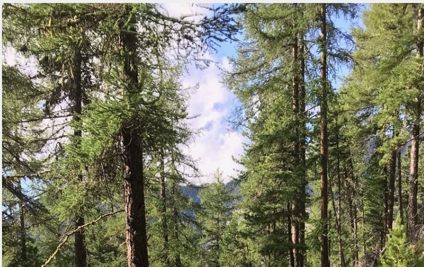
(OT les Orres)