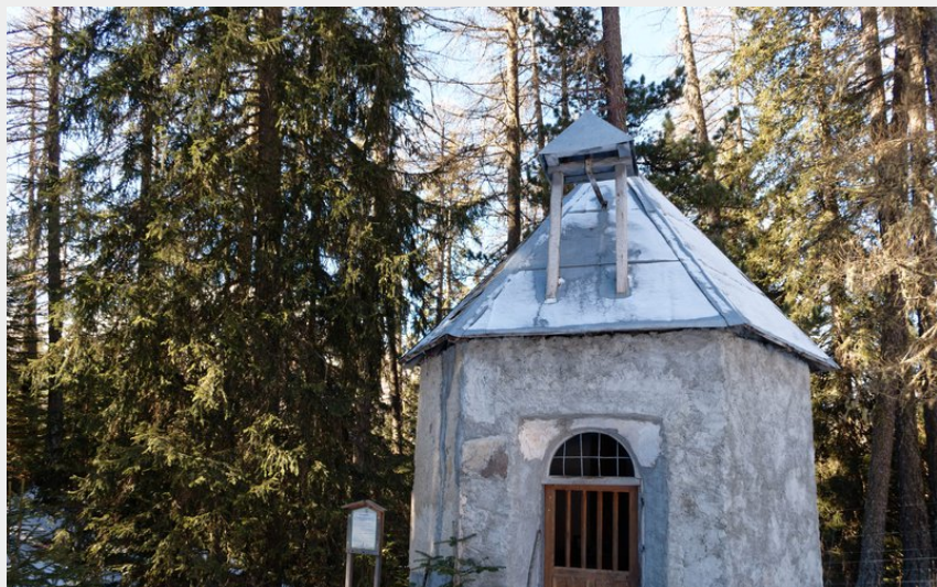
Chapelle du Lauzerot (Lucien Mariotte)