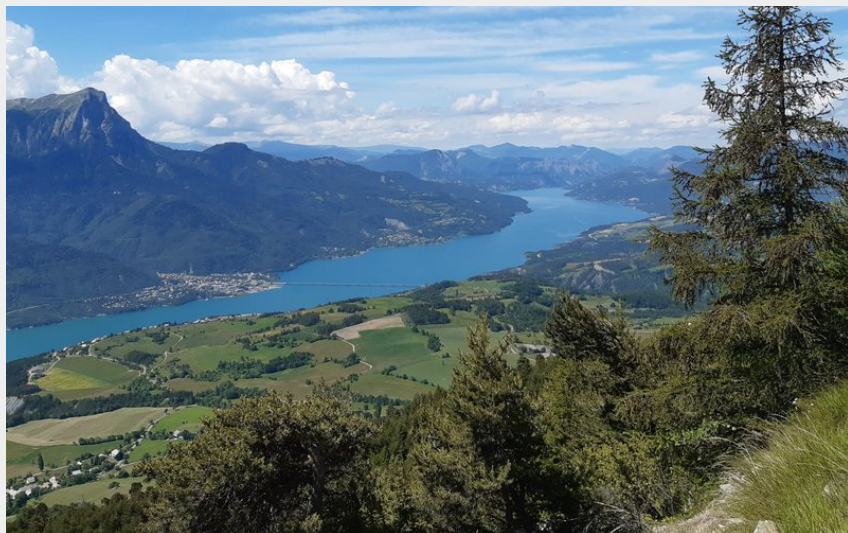
Vue depuis le belvédère de Para (florimont.tilliere)