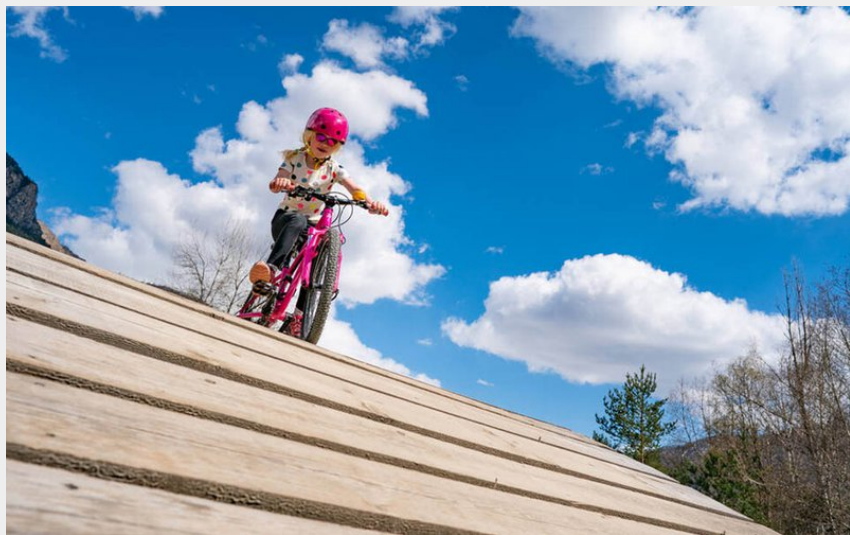
(Rogier Van Rijn)