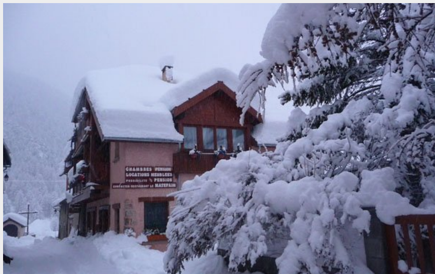
Crédit photo : Vue extérieur hiver Gîte le Matefaim Ceillac (Le Matefaim)