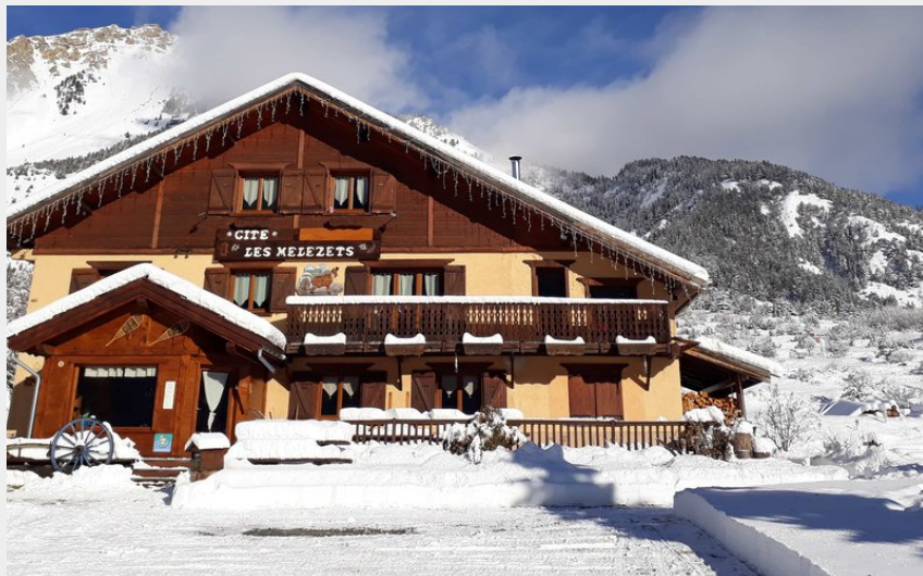
Crédit photo : Les Melezets hébergement où dormir (©Gîte les Melezets)