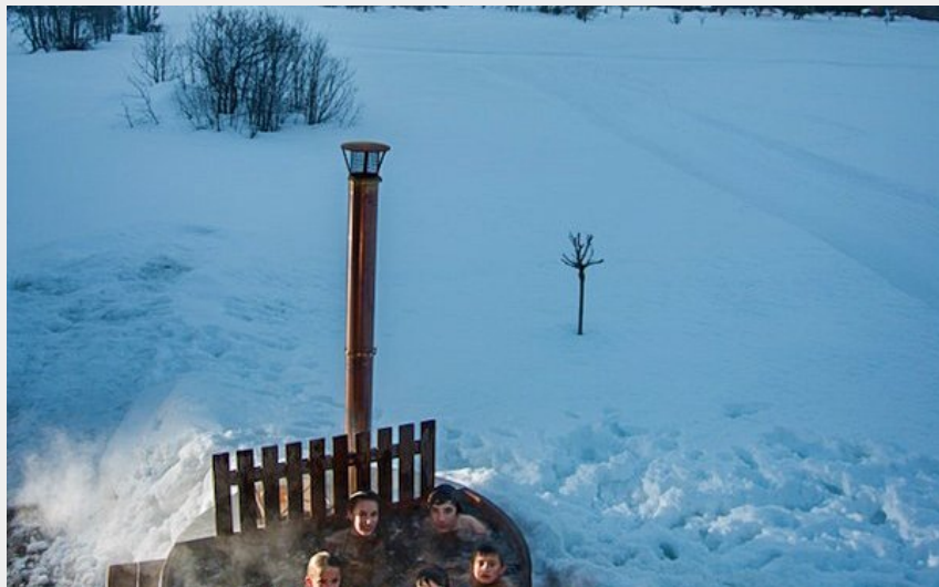
Crédit photo : Chalet de l'Onde_Vallouise-Pelvoux (Chalet de l'Onde_Vallouise-Pelvoux)