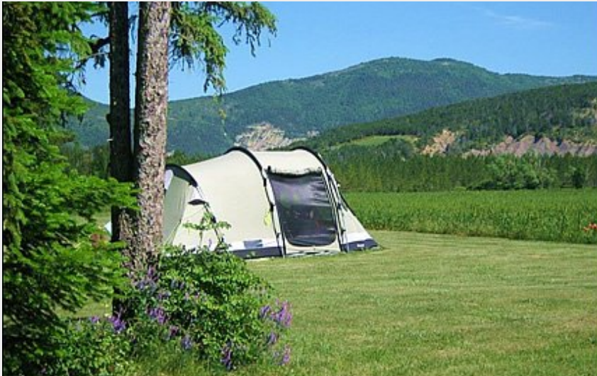
Crédit photo : emplacement (camping la Source St Pierre d'Argençon)