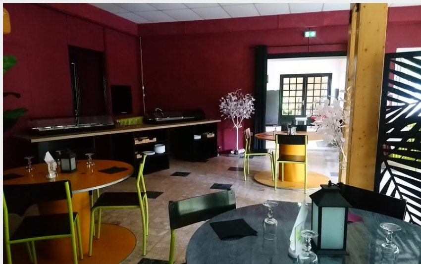
Les Glaciers à La Chapelle en Valgaudemar