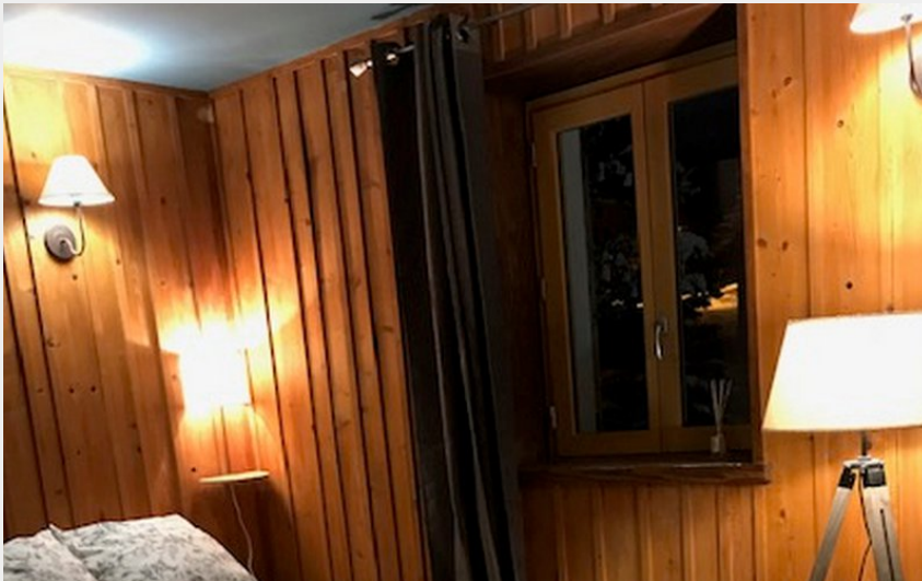
Crédit : Chambre 2 personnes