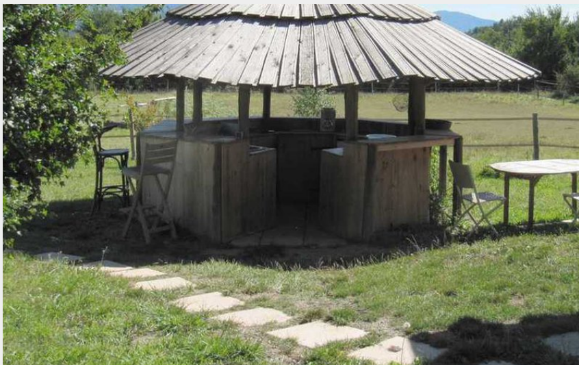
Crédit photo : Cuisine d'été le Relais du Terrail (Office de Tourisme Sisteron Buëch)