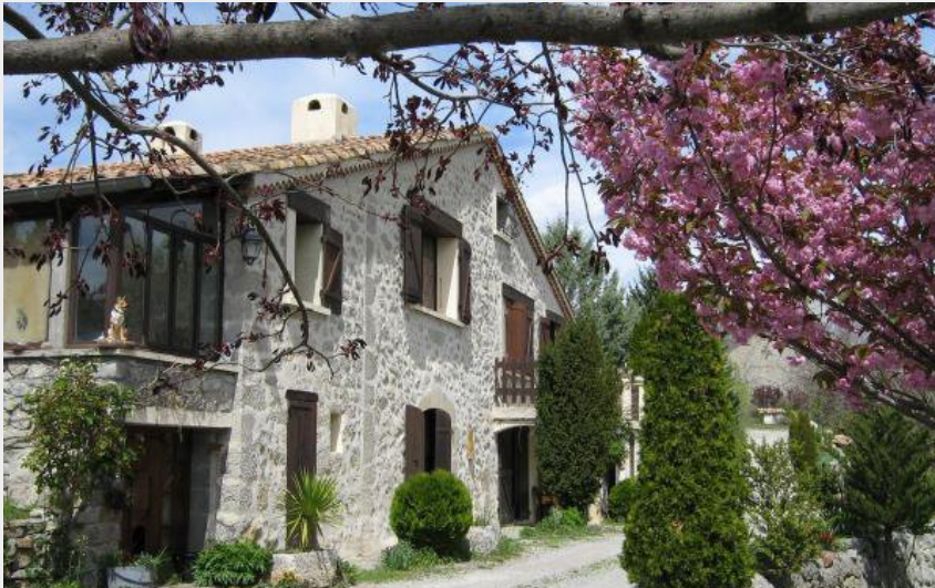
Crédit photo : Entrée des chambres (Chambres d'hôtes Le Moulin d'Aimée Savoumon)