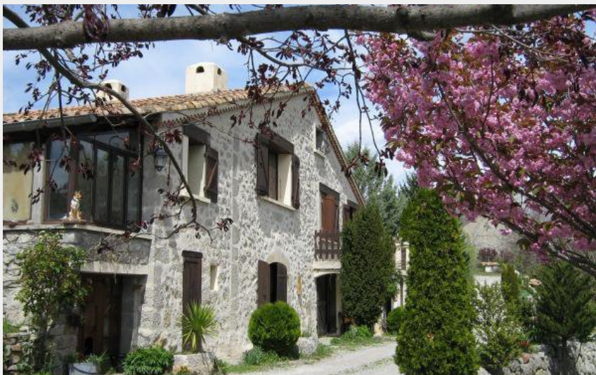
Crédit photo : Entrée des chambres (Chambres d'hôtes Le Moulin d'Aimée Savoumon)