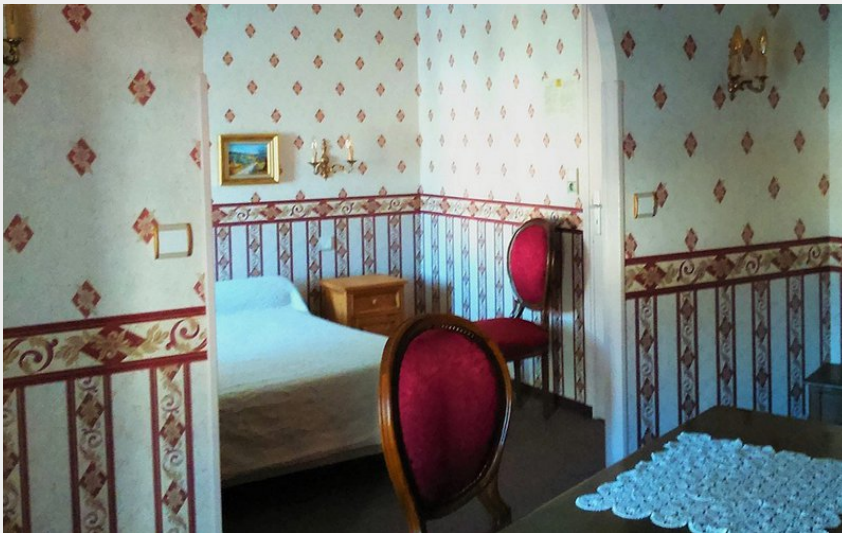
Crédit photo : Hôtel-restaurant Le Bercail à Chauffayer, vallée du Valgaudemar (Le Bercail)