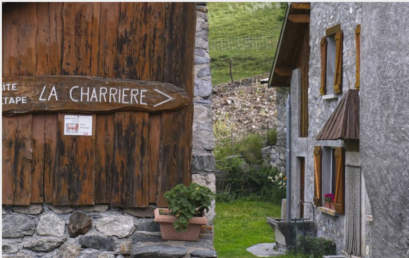
Crédit photo : Gîte La Charrière, vallée du Valgaudemar (Gîte La Charrière)