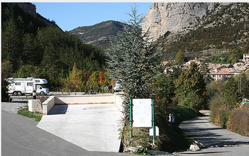
Crédit photo : Aire de service camping cars (Camping Les Princes d'Orange)