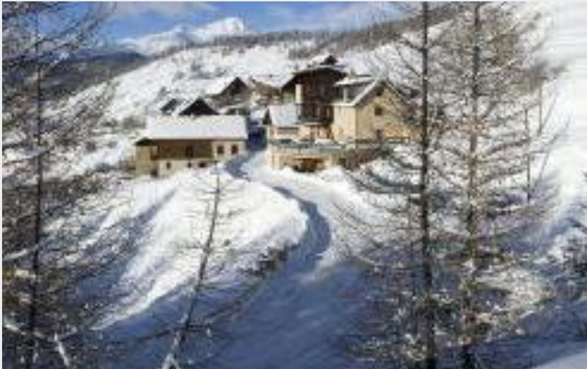
Crédit photo : Gîte de Prat Haut -Gîte d'étape/séjour -Chateau-Ville-Vieille -Queyras