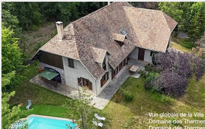
Vue globale de la Villa Domaine des Thermes Domaine des Thermes