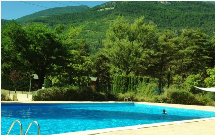
Crédit : Piscine du camping