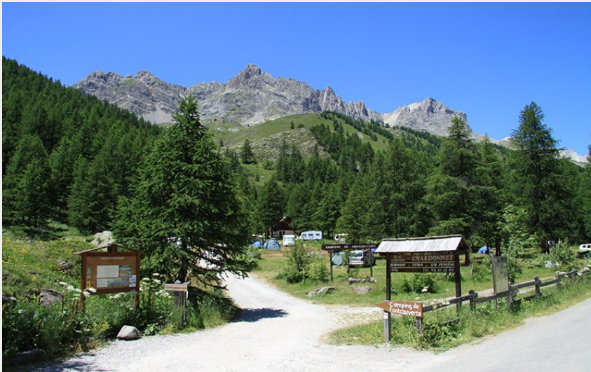
Crédit : camper dormir Clarée aire naturelle (Camping Fontcouverte)