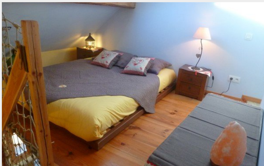
Crédit : Intérieur d'une chambre, Chambre lit double,