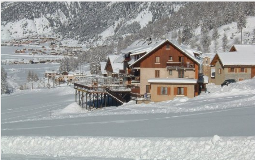
Crédit : Vue Hiver -Hôtel La Cascade Ceillac