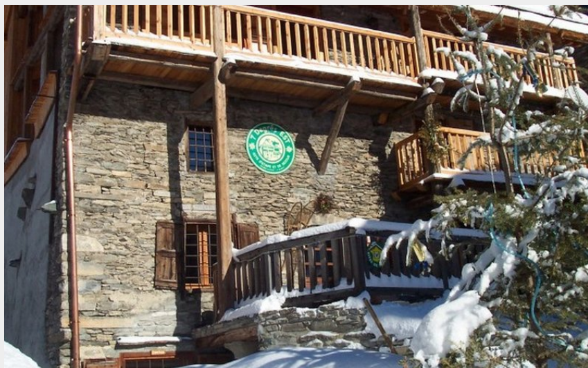
Crédit : Extérieur du gîte en hiver