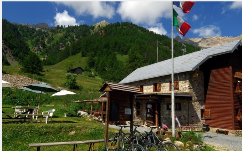
dormire rifugio Névache vallee stretta