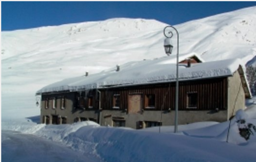
Extérieur du Chalet Alpage Tangente l'hiver