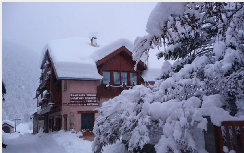
Crédit photo : Vue extérieur hiver Gîte le Matefaim Ceillac (Le Matefaim)