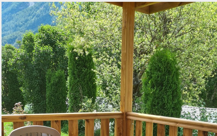
Crédit : Camping Les Auches mobilhome à Ancelle, vallée du Champsaur (Les Auches)