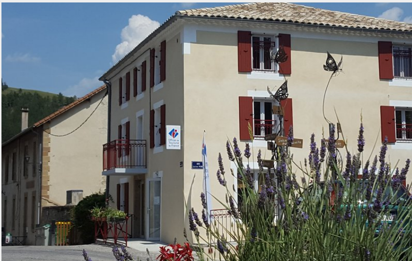
Crédit : Extérieur (Office de Tourisme Sisteron Les Alpes provençales)