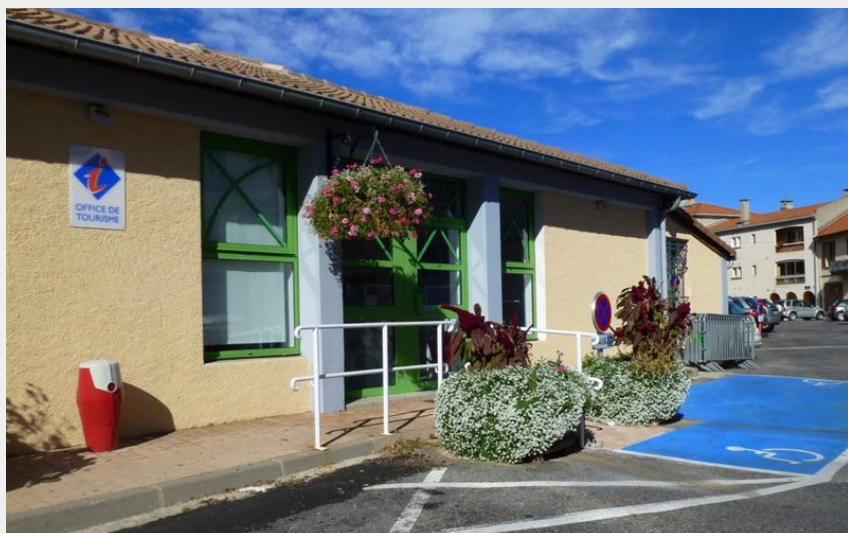
Crédit photo : Rampe d'accès et place handicapé (Office de Tourisme Sisteron Buëch)