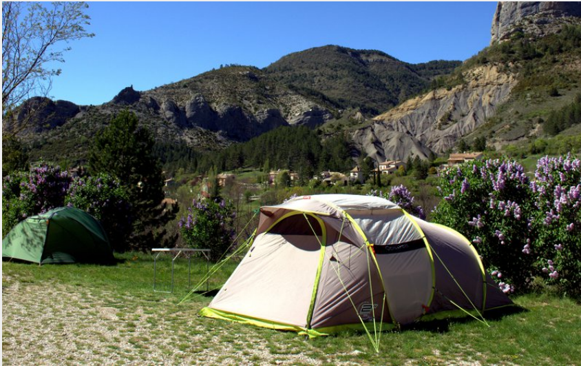
Crédit photo : Emplacement avec tente (Camping des Princes d'Orange)