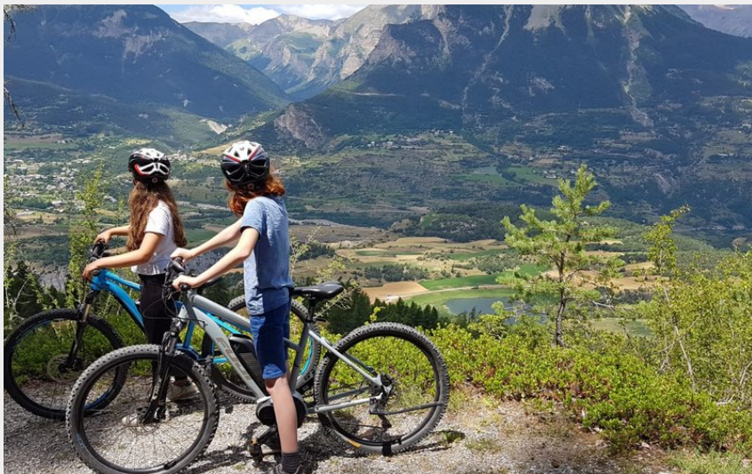
Crédit photo : EBIKE Montagne SAINT-ANDRÉ D'EMBRUN (EBIKE Montagne)