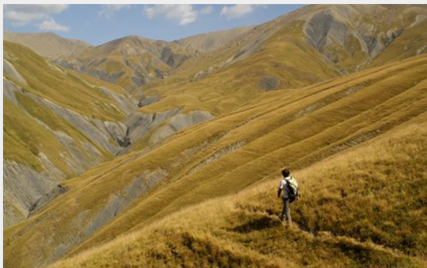
Vers le col de Martignare - La Grave