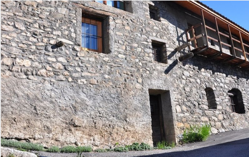
La façade - Gîte Le Dahut - Les Hières - La Grave