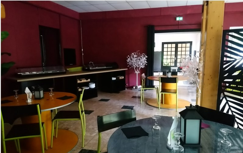
Les Glaciers à La Chapelle en Valgaudemar