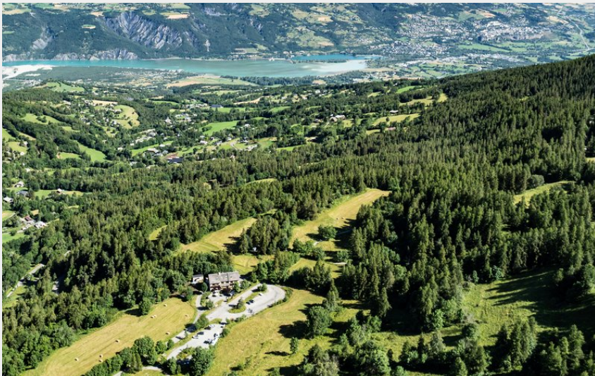
La Draye et le Mont Guillaume en toile de fond