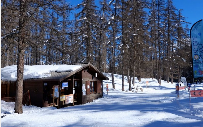
Chalet nordique de Puy Saint Vincent (Pierre Nossereau)