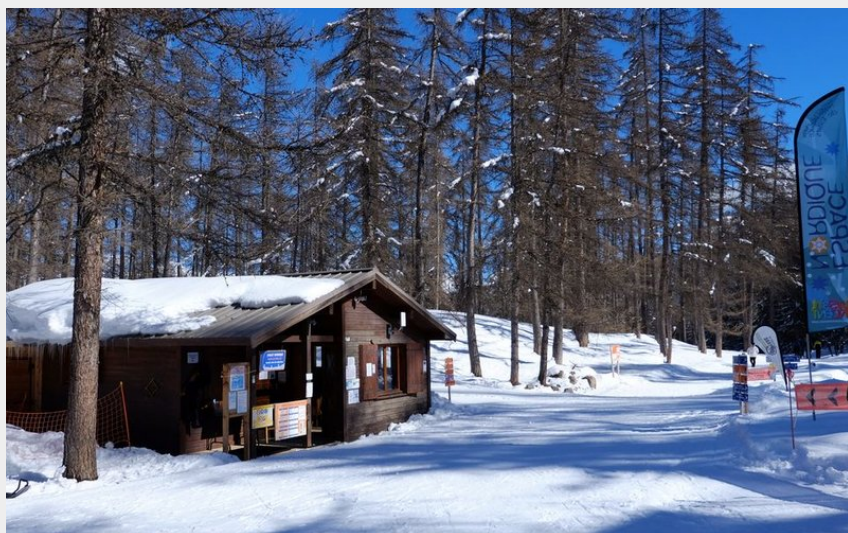
Chalet nordique de Puy Saint Vincent (Pierre Nossereau)