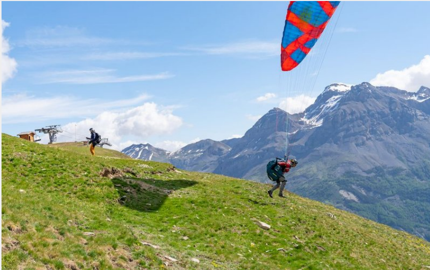
Décollage près du télésiège de la Crête (Rogier van Rijn)