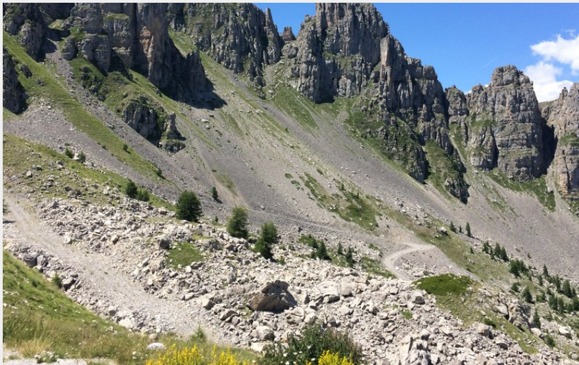
Les Aiguilles (OT Serre-Ponçon)