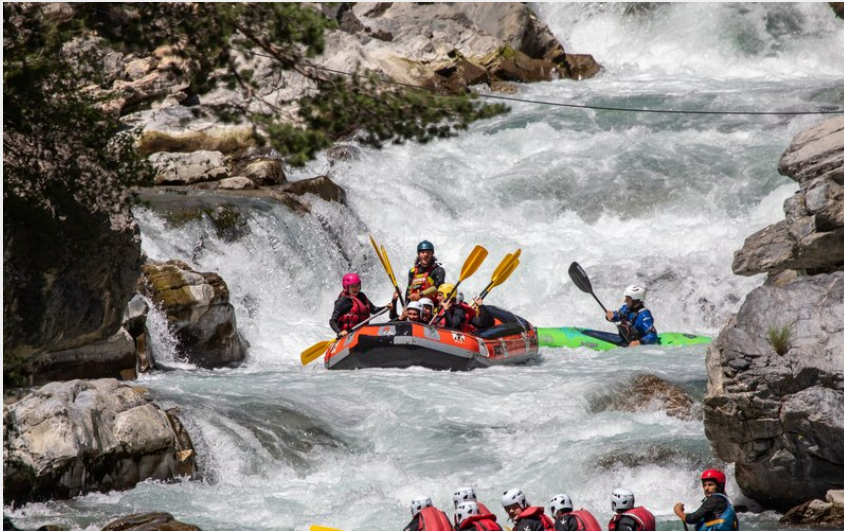
Le passage mythique de la triple chute