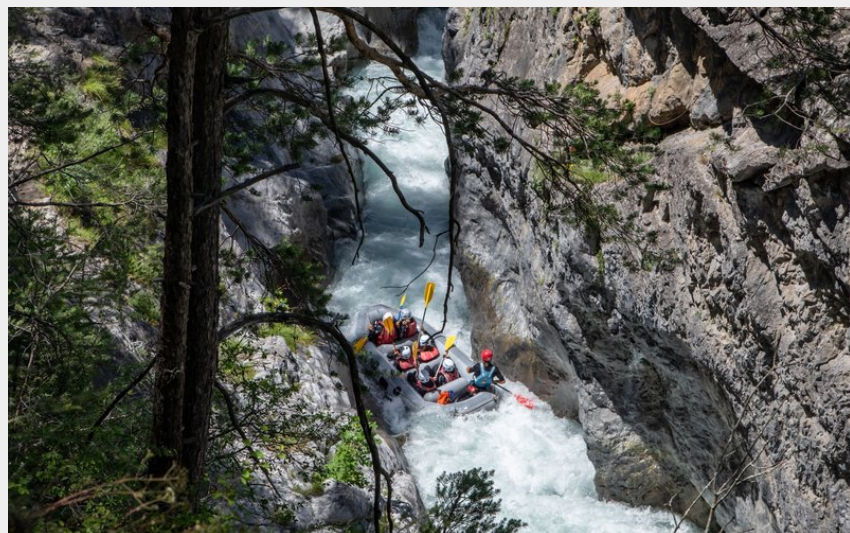
Dans la combe de Château-Queyras