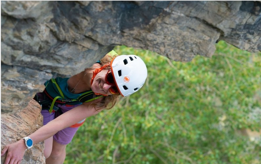
Via les Vigneaux (rogiervanrijn)