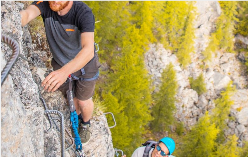
Deux Hommes sur la roche d'une Via Ferrata