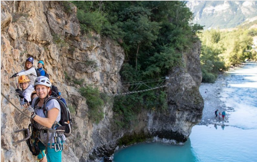
Groupe de personnes sur Via Ferrata devant la Durance