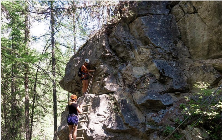
Via ferrata de la combe Puy Saint Vincent (Blandine Reynaud)