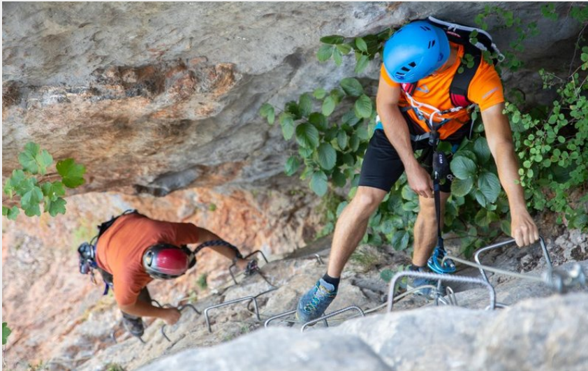
Deux personnes grimant sur la roche d'une Via Ferrata