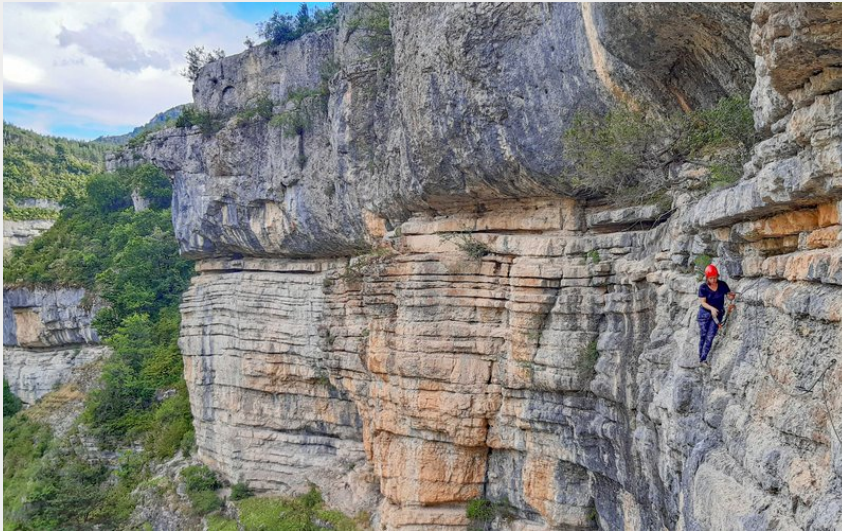
Via Ferrata des gorges d'Agnielles (D.Desbenoit)