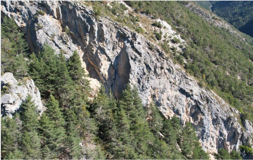
Paroi du Villars