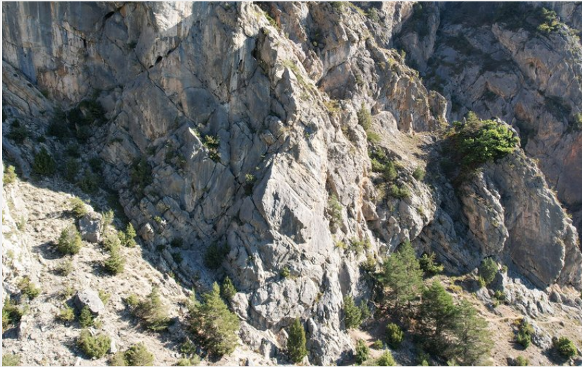
(nicolas Bianchi @Parc national des Ecrins)