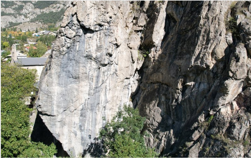
(Nicolas Bianchi - Parc national des Ecrins)